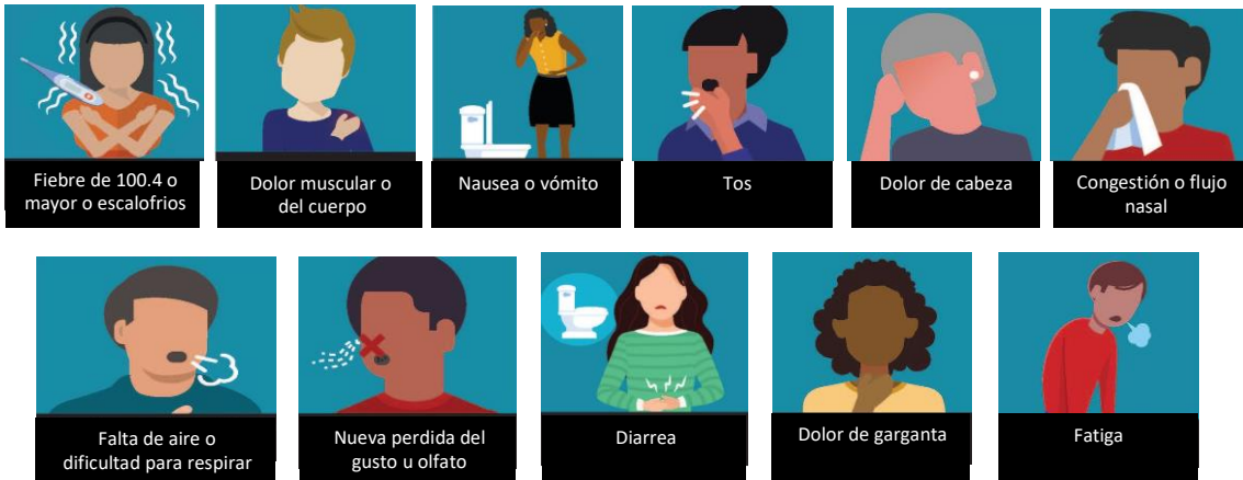
Diagrama de Flujo de Covid-19